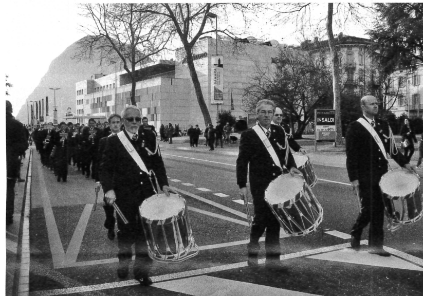
I tamburini della Civica Filarmonica aprono il drappello dei musicanti nel corteo che sta per giungere al Palazzo dei Congressi.