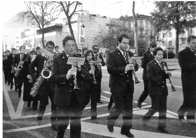
I musicanti della Civica Filarmonica hanno animato e ritmato la sfilata.